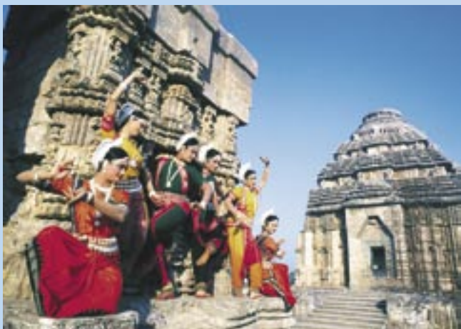
Gammel kultur, vakre bygninger og fargerike mennensker. Slik er det gyldne triangel, masse spennende opplevelser venter deg der!

Delhi, Agra og Jaipur utgjør "The Golden Triangle". Her kan man se Old og New Delhi, storby og gammel kultur om hverandre. Jaipur, hovedstaden i Rajasthan med palasser og fort, samt byen Agra som er berømt for monumentet for "Evig Kjærlighet" - Taj Mahal.